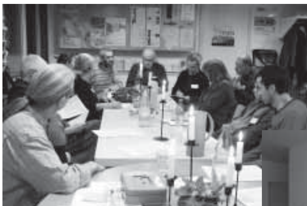
Feierabendtreff im Kafi Tintefisch