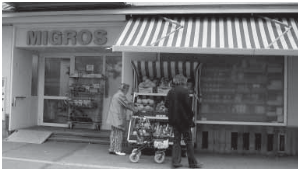
Der kleine Migros an der Landenbergstrasse hat bald ausgedient.

Schon in naher Zukunft wird der Migros an die prominente Lage Scheffelstrasse 3 / Nordstrasse 220 ziehen und das heute dort beheimatete Schuhgeschäft Dosenbach sowie das Restaurant Café Romand im 1. Obergeschoss ersetzen.