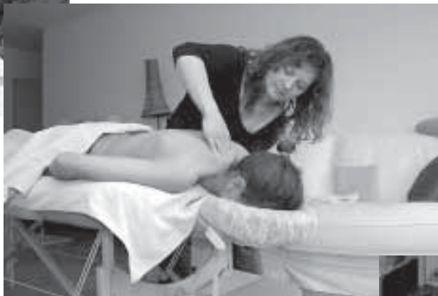
Tauschgeschäft: Eine wohltuende Massage