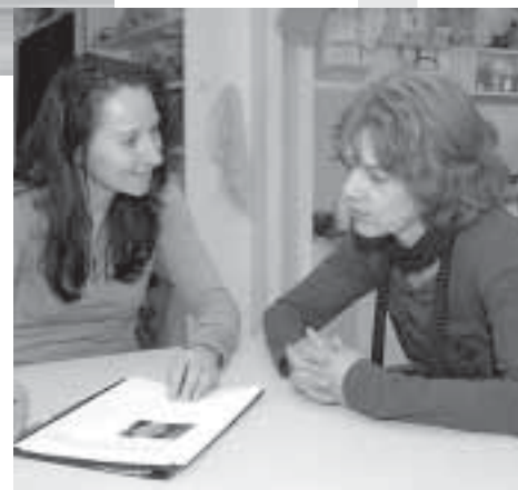
Tauschgeschäft: Ein Bewerbungscoaching