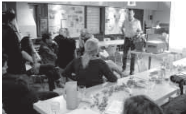
Wissenstausch: Input zum Thema Bananen