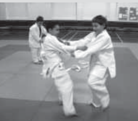
Kindertraining in der Turnhalle Letten