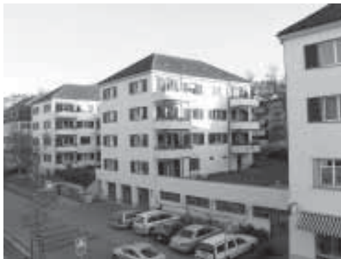
Die Abrissobjekte der Baugenossenschaft Denzler.

Die verdichtete Bauweise bei den Arealüberbauungen wird rechtlich unter anderem damit gerechtfertigt, dass diese «besonders gut gestaltet» sein müssen. Diese Qualität kontrolliert eine Jury. Der Quartierverein Wipkingen wurde nun von der Anwohnerschaft Höggerstrasse beauftragt, bei der Stadtverwaltung nachzufragen, warum dem Triangoli-Projekt mit den dreieckigen Gebäuden der Vorzug gegeben wurde, obwohl die Jury diesem Projekt keine besonders gute städtebauliche Qualität attestiert. Das Projekt Semiramis schneidet gemäss Jury bedeutend besser ab. Die Stellungnahme der Stadtverwaltung war bis zum Redaktionsschluss ausstehend.