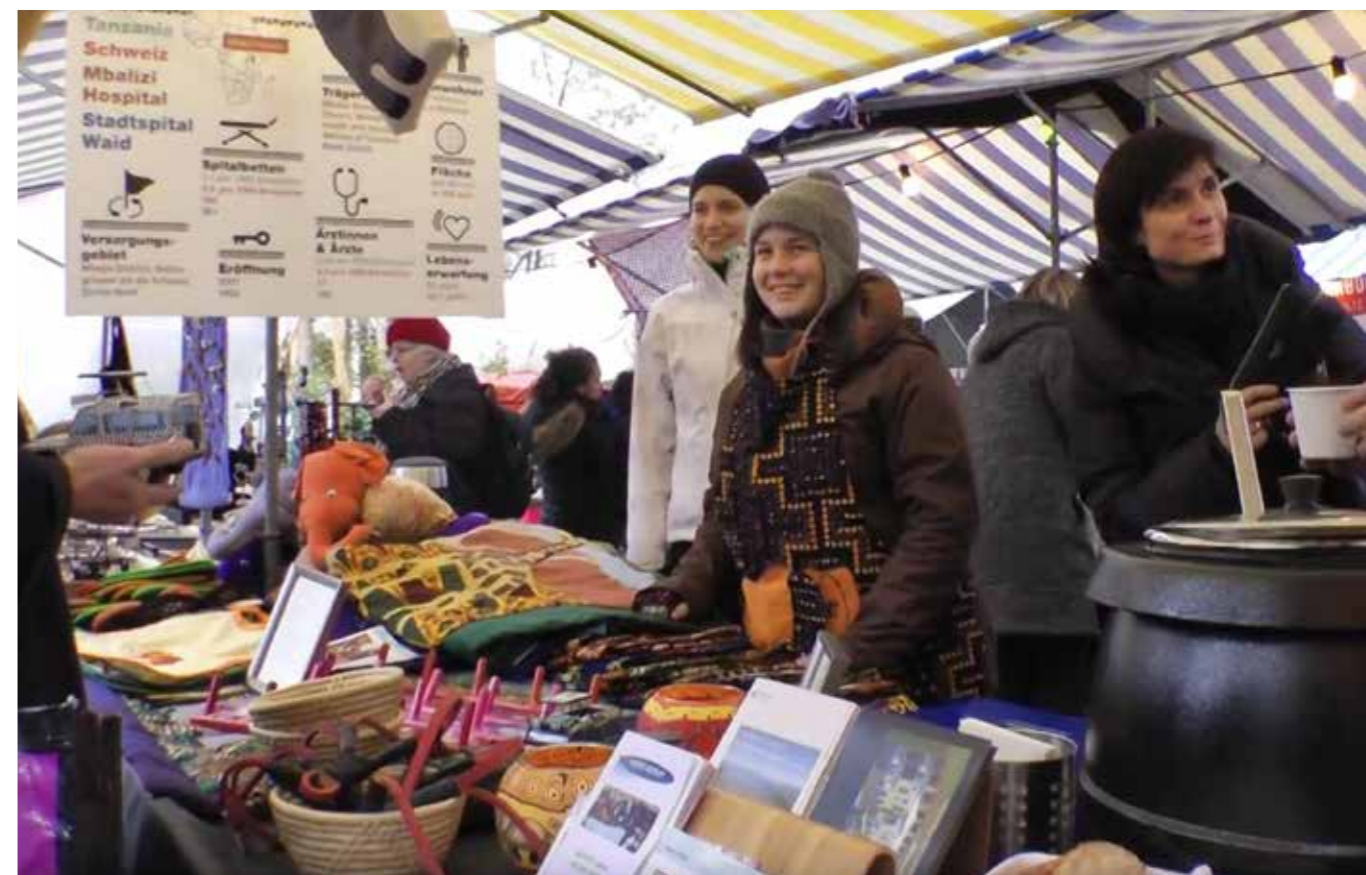
Trotz kalter Witterung war der Andrang beim Weihnachtsmarkt gross.

Der diesjährige Weihnachtsmarkt findet am 26.11.2016 auf dem Röschibachplatz statt.