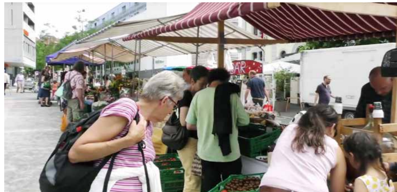
Ab diesem Frühling findet auf dem Röschibachplatz ein wöchentlicher Markt statt.

Bewohnerinnen und Bewohner entspricht. Gemäss Umfrageergebnis begrüsst eine überwältigende Mehrheit einen wöchentlich stattfindenden Markt am Samstag von acht Uhr morgens bis vier Uhr nachmittags. Wir freuen uns darauf ab März einen eigenen Frischmarkt auf dem Röschibachplatz zu haben.