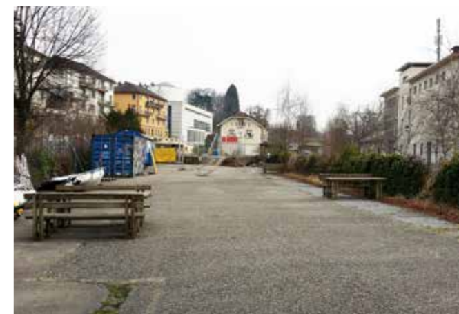
Ab Juni wird der Platz belebt.