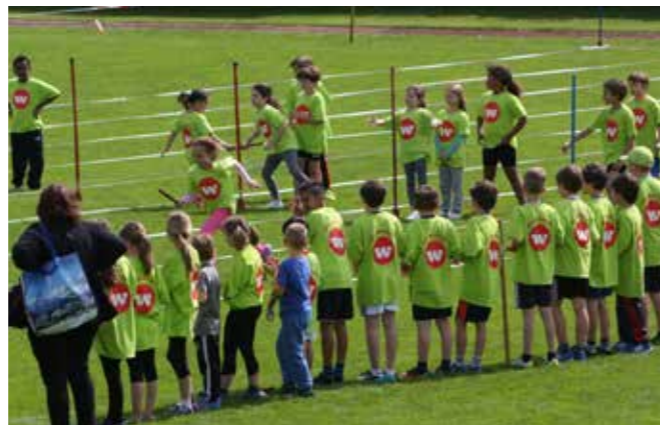
Schnelle Kids aus Wipkingen auf dem Sportplatz Hönggerberg.

«De schnällscht Zürihegel» findet dieses Jahr am 21.05.2016 statt. Weitere Infos unter www.wipkingen.net