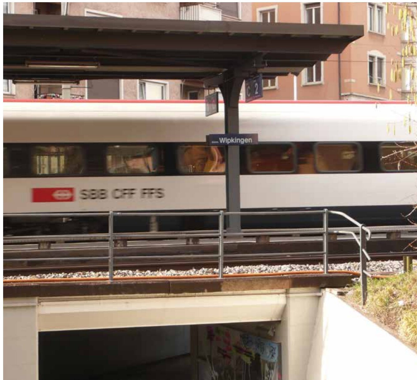
Hoffentlich halten bald wieder mehr Züge in Wipkingen – der QVW bleibt dran.

Der QVW bleibt in der Zwischenzeit nicht untätig und wird weitere Massnahmen ins Auge fassen und umsetzen.