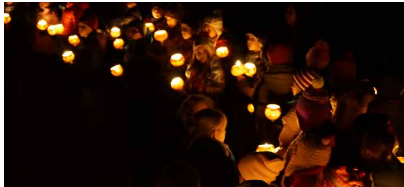
Immer wieder schön: wenn die geschnitzten Räben im Dunkeln leuchten.

Der diesjährige Räbeliechtliumzug findet am 05.11.2016 statt.