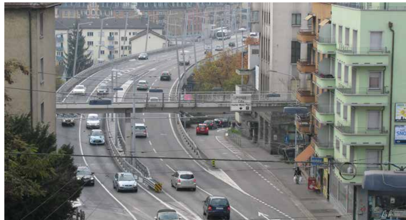
Zum Verkehrslärm kommt der nächtliche Baulärm hinzu.

Für den Quartierverein ist klar: Künftige analoge Bauvorhaben müssen zum Schutz der jeweiligen AnwohnerInnen dem Gedanken der Opfersymmetrie als selbstverständlichem Handlungsparameter Rechnung tragen. Dafür müssen sich die politisch Verantwortlichen unmissverständlich einsetzen!