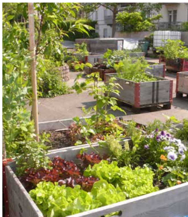
Bald werden wieder Salate, Gemüse und Blumen gedeihen.