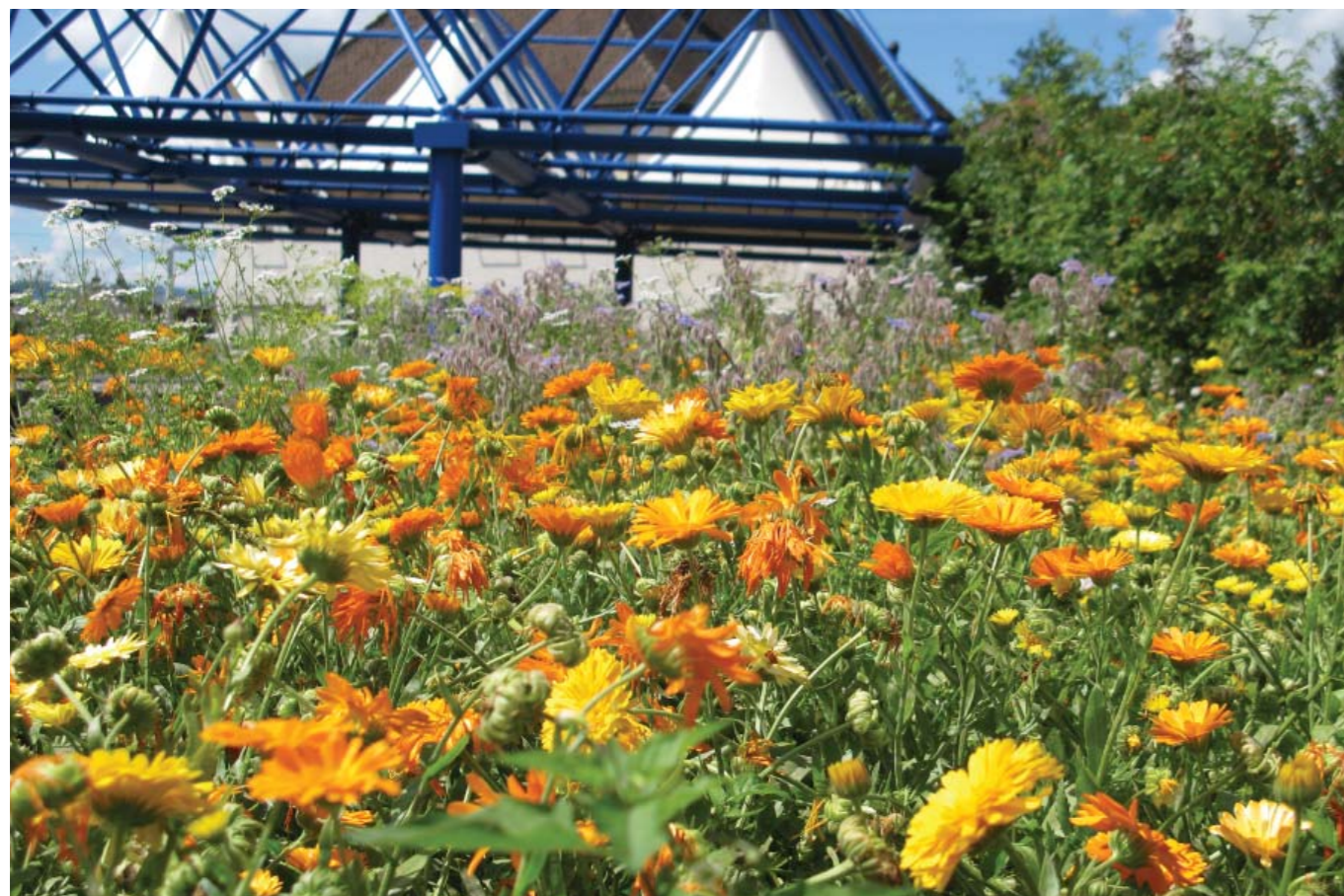
Postterrasse, Bild: S. Berdelis (Tiefbauamt)

Dieses Jahr will die Stadt die Bepflanzung und Nutzung der Terrasse weiterführen. Für die Wintermonate wurden Nüssli-salat und Spinat angesät. Auch Tulpenzwiebeln wurden gesetzt. Der QVW begrüsst die Massnahmen, die dazu beitragen, dass der Ort nicht ganz verwahrlost.