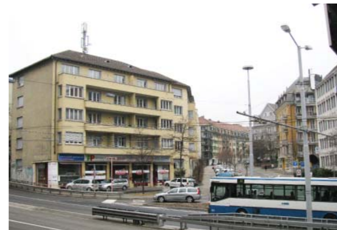
Die Busse hätten an der geplanten Ampel auf der Höhe Röschibachstrasse den Vortritt.

Noch ist das Projekt nicht unter Dach und Fach. Die Stadt wartet auf den Entscheid der kantonalen Volkswirtschafts-direction, der das Amt für Verkehr untersteht. Indes werden im Kantonsrat Stimmen laut, die durch die Fussgängerstreifen einen Zeitverlust der Automobilisten und somit einen «grossen volkswirtschaftlichen Schaden» sowie eine erhöhte CO 2 -Belastung befürchten. Für die Stadt hingegen bedeutet das Verkehrslenkungskonzept weniger Stau in der Rosengartenstrasse und somit auch weniger CO 2 . Fällt der Entscheid