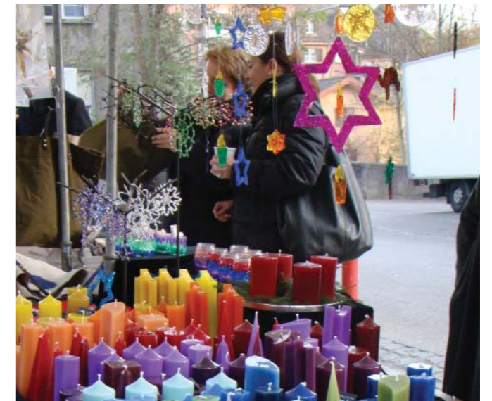
An 35 Ständen konnten die Besucher vorwiegend selbstgemachte Artikel kaufen.