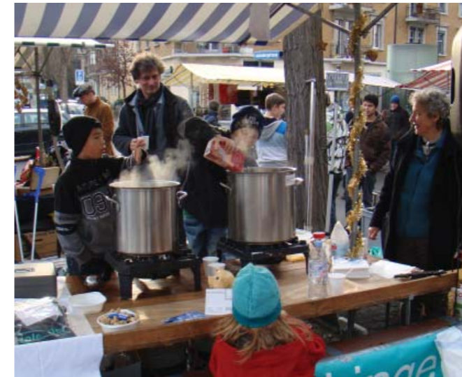
Am QV-Stand gab's heissen Most oder Glühwein und feine Suppe