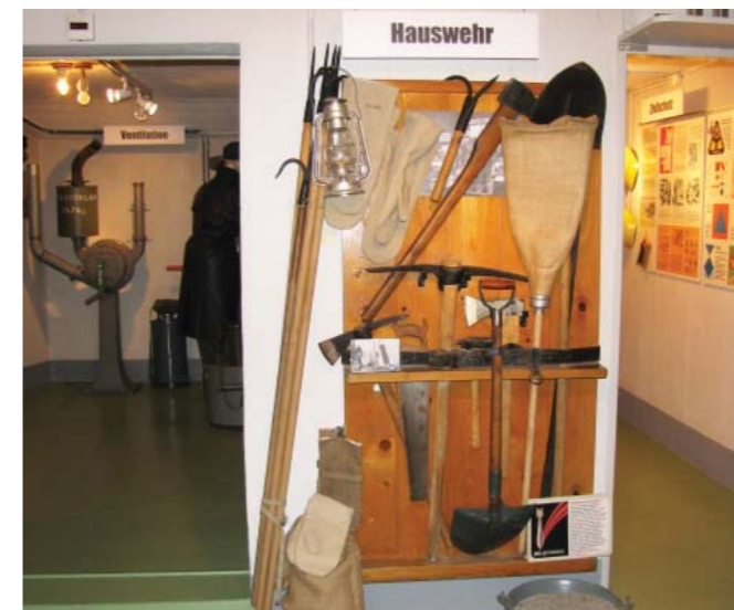
Anfangs der 40er-Jahre musste jeder Haushalt über eine sogenannte Hauswehr verfügen: mit dem Sand liess sich notfalls ein Brand eindämmen, mit der Schaufel eine eingeschlagene Bombe – noch bevor sie explodierte – wieder aus dem Fenster werfen.

Der Angriff blieb aus – und die Sanitätshilfsstelle wurde nie in Betrieb genommen. In den 60er-Jahren entstand im untersten Stock des Bunkers ein Kommandoposten, den man noch heute besichtigen kann. Ab den 80er-Jahren dienten alle Räumlichkeiten lediglich als Lager. Die Einrichtung wurde jedoch nie