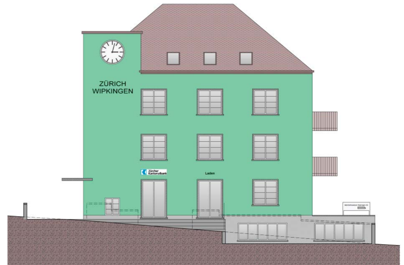
Fassadenplan des umgebauten Bahnhofs: Einen zarten Grünton soll er haben.

Urs Räbsamen, was ist für Sie die Motivation, solch alte Objekte zu sanieren – neben dem Reiz, etwas Schönes