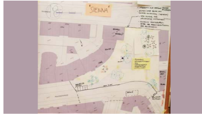
Das Siegerprojekt des Workshops vom 5. Juli 2011 heisst «Siena» – eine Anspielung auf den schrägen Platz der italienischen Provinzhauptstadt. Es sieht einen verkehrsfreien und weiterhin schrägen Röschibachplatz vor.