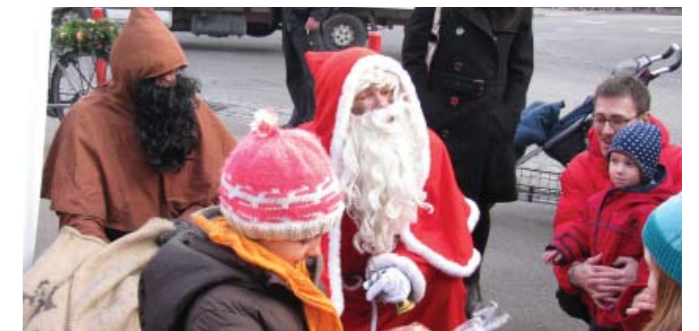
Sogar der Samichlaus kam zu Besuch und verteilte Säckli für die Kleinen.