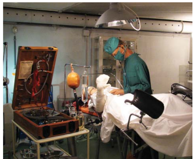
Auch für Schwerverletzte war die Sanitätshilfsstelle gerüstet. Im ehemaligen Behandlungsraum sind OP-Bestück, Sterilisationsinstrumente sowie ein Beatmungsgerät im Originalzustand erhalten.

Mehr Infos auf www.stadt-zuerich.ch/zivilschutzmuseum Film der Museumsführung auf www.telewipkingen.ch