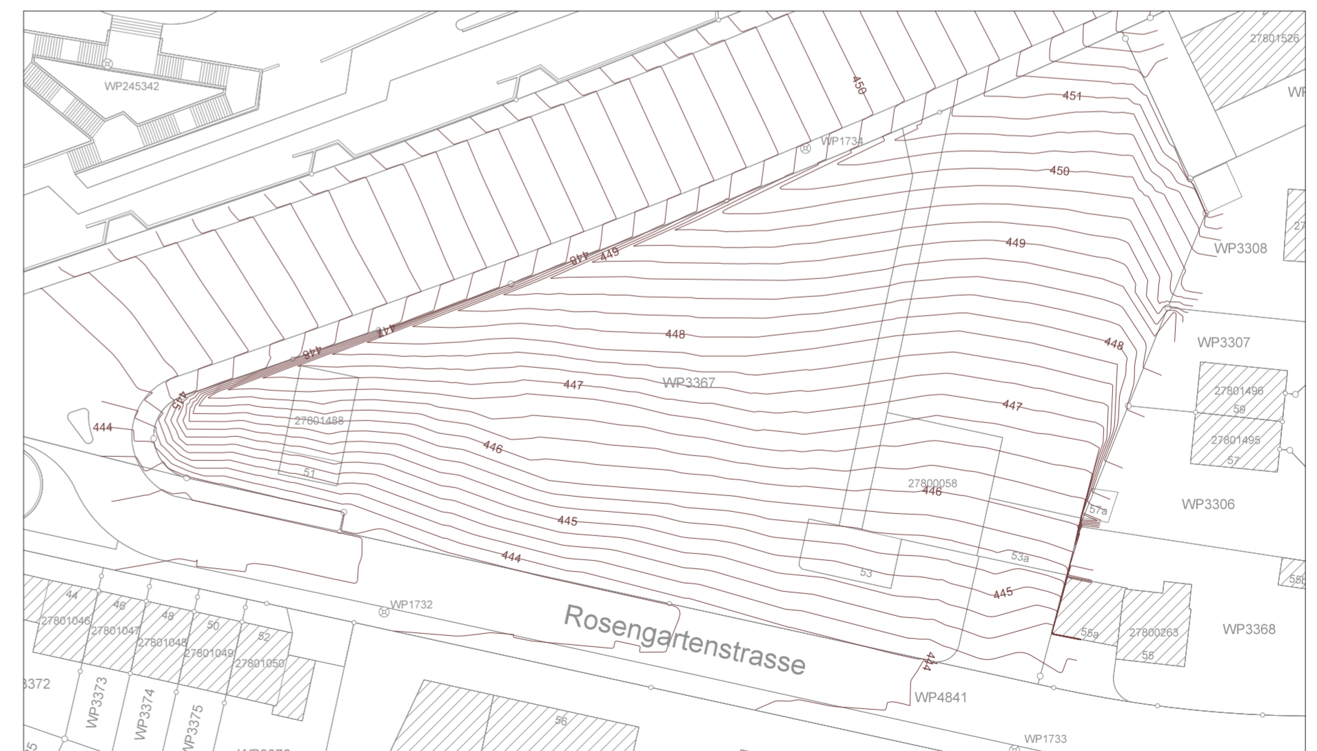
Massgebliches Terrain, Grundriss mit Höhenlinien