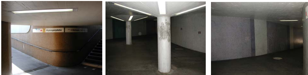
Bilder Unterführung Nordstrasse

Das Bearbeitungsgebiet der Aufwertung umfasst die Unterführung Nordstrasse inklusive Auf- und Abgänge.