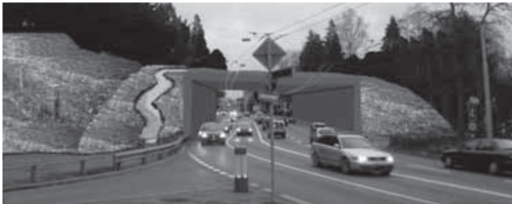
Unsere Vision «Parkverbindung Rosengarten» stiess beim Stadtrat auf Interesse.

Die Stimmung war gut, und wir hatten den Eindruck, dass unsere Stadtmütter und –väter unsere Ideen wohlwollend und mit Interesse aufnahmen. Ausführlicher Bericht zum Stadtratsbesuch unter wipkingen.net im Archiv 2009.