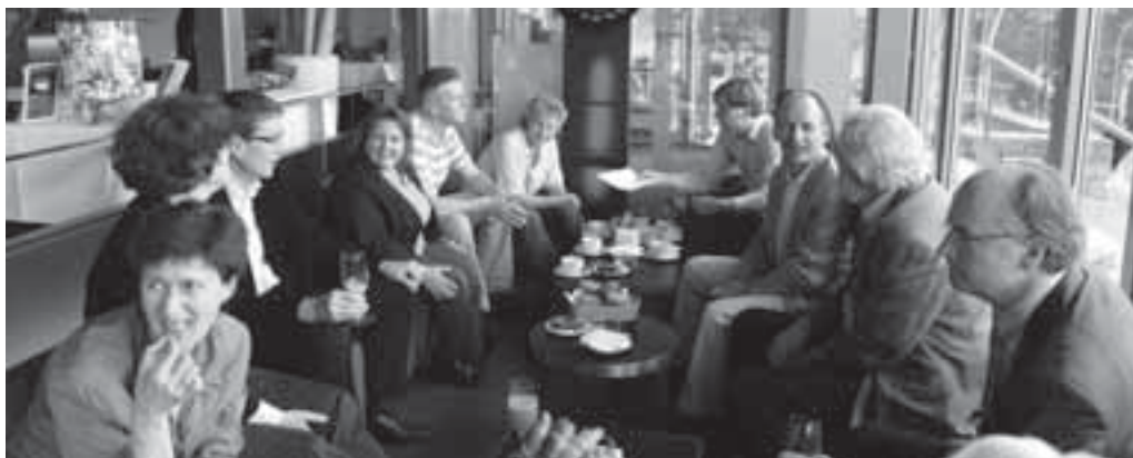
Stadtrat im Restaurant Waid vor dem Quartierrundgang

Der Stadtrat besucht jedes Jahr einen QV, dieses Jahr waren wir dran. Der QV warb für Sympathie und verwöhnte den Stadtrat mit Gaumenfreuden im GZ.