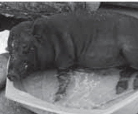
Minipig Otto