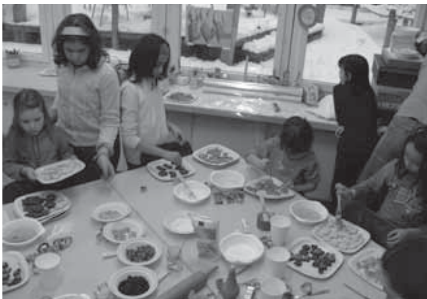
«Guetzle und Gschichte» – alles Weitere zum grossen Weihnachtswerken auf S. 9