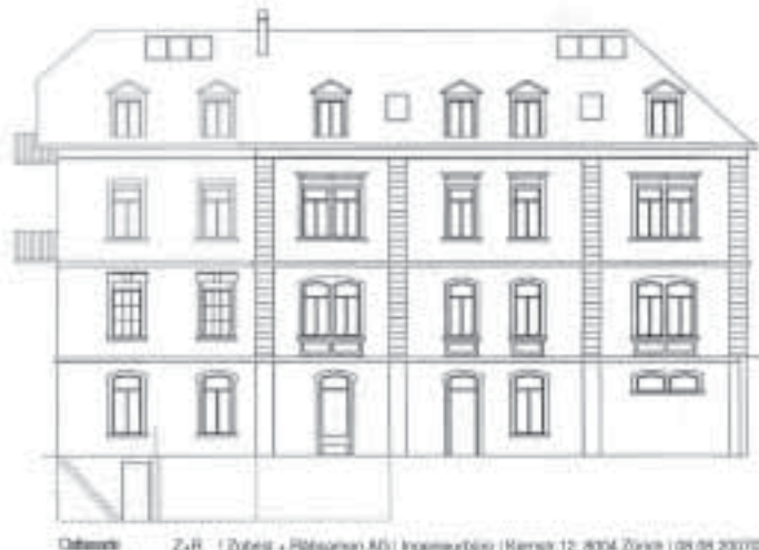
Detaillierte Umbaupläne auf www.wipkingen.net