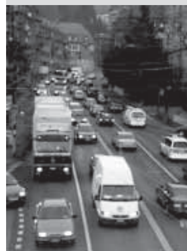
Initiative Westtangente Plus für Verbesserungen am Rosengarten sammelt bis am 11. Februar 2008 Unterschriften.