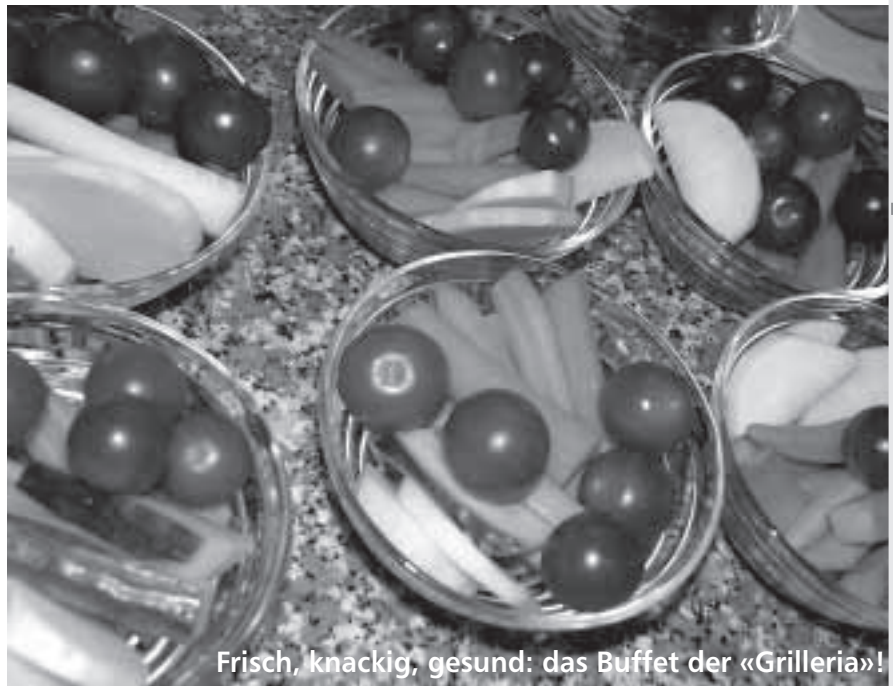
Frisch, knackig, gesund: das Buffet der «Grillieria»!