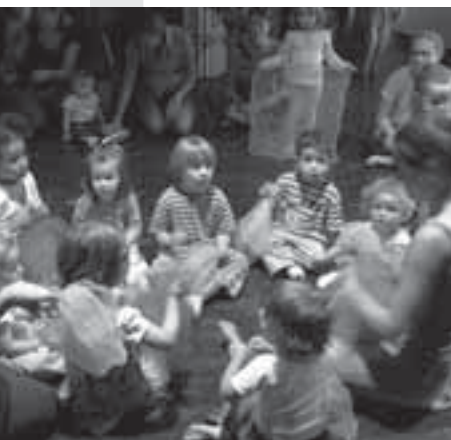
Kinderzwerqli Kreativer Kindertanz

Donnerstage, 9.30 – 11.30 Uhr im Werkatelier (nicht in Schulferien) Auch für die Kleinsten wird gesorgt im GZ Wipkingen! Kinder ab ca. 1 bis 1 1/2 Jahren mit Begleitung können jeweils am Donnerstagvormittag in das offene Malatelier kommen, wo nach Lust und Laune gemalt wird. Ziel ist, der Fantasie der Kleinen auf einem weissen Stück Papier freien Lauf zu lassen (und die Wände zu Hause zu schonen). Nach dem Malen kann im Kafi Tintefisch der Hunger gestillt oder auf dem Seilspielplatz der Spieldrang der kleinen «SchöpferInnen» befriedigt werden. Für Kinder ab ca. 1 Jahr. Keine Anmeldung nötig! Preis: Pro Papier Fr. 1.50 bis Fr. 3.- (je nach Grösse). Leitung: Michelle Durham , Tel. 044 440 60 89 E-Mail: michelle.durham@bastianello.net