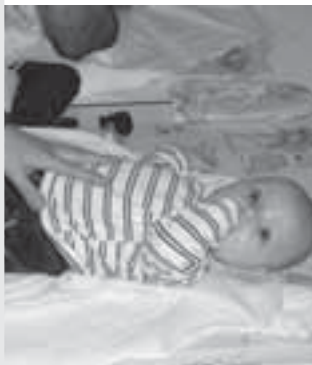
Mütter- und Väterberatung