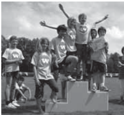
Die «Six No Names», Gewinner des Stafettenlaufs der 3.-Klässler (Schulhaus Waidhalde).