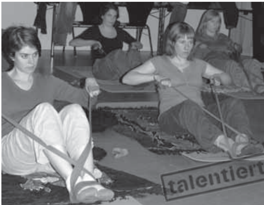
Talente leben, vertiefen, ausprobieren – Pilates Gruppe im Training.