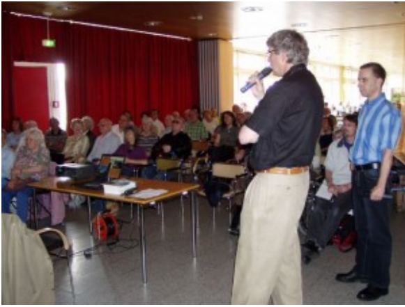
Eine Lichtbildschau mit den alten und neuen Bilder begeistert die Zuhörer