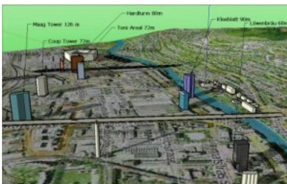
Ansicht von Osten