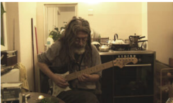
An der E-Gitarre