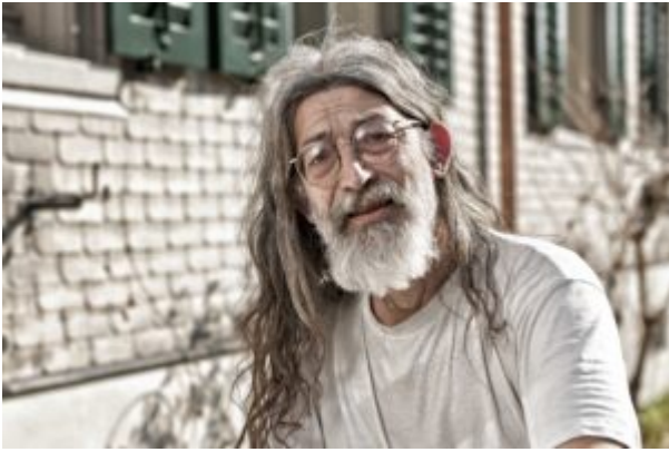
Vor seinem Schindelhaus