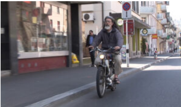
Auf seinem Töffli auf der Nordstrasse