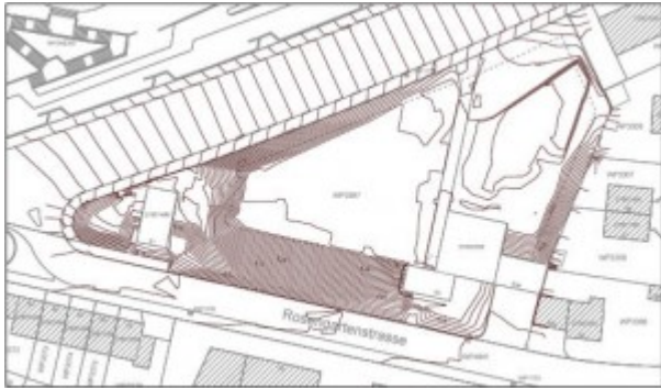
Gegebenes Terrain, Grundriss mit Höhenlinien

gleichmässig abfallenden Hang mit linearer Steigung. Es wird hierbei auf historisches Planmaterial zurückgegriffen. Der Terrainausgleich bietet zudem auch für den geplanten Quartierpark Vorteile.